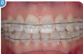
Aparelho Ortodontia | Cerâmico