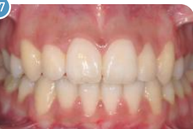
Adulto | Depois do uso do aparelho