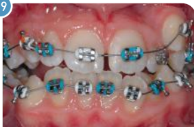
Aparelho Ortodontia | Cor