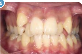
Adulto | Antes do uso do aparelho