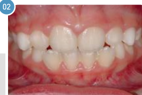
Criança de 7 anos | Depois do uso do aparelho