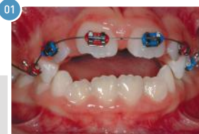
Criança de 7 anos | Durante o uso do aparelho